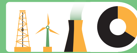
En el año 2010, los edificios concentraron el 32% del consumo global de energía final.