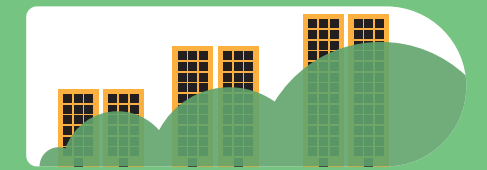
Las emisiones de CO 2 en el sector de la construcción podrían duplicarse o triplicarse para el año 2050.